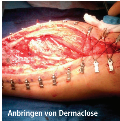
Anbringen von DERMACLOSE