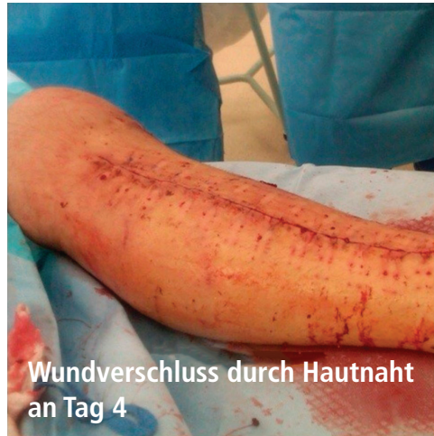
Wundverschluss durch Hautnaht an Tag 4