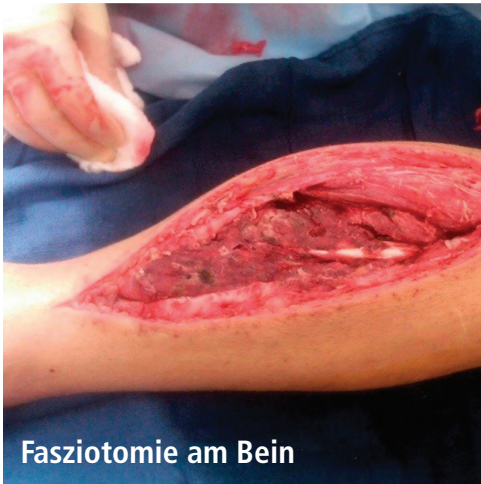
Fasziotomie am Bein