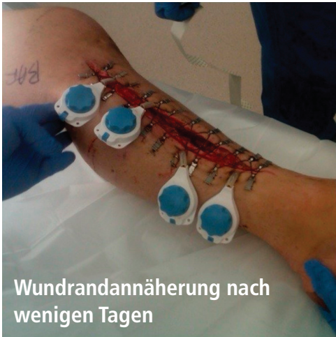
Wundrandannäherung nach wenigen Tagen